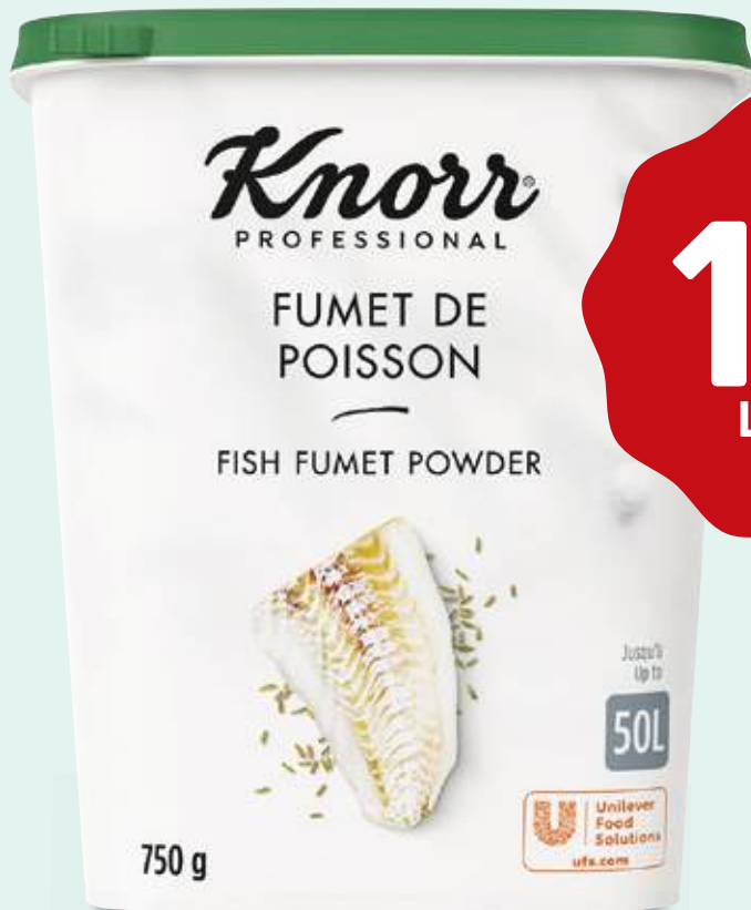
FUMET DE POISSON DÉSHYDRATÉ KNORR Boîte de 750 g (jusqu'à 50 l) Colis de 6 Code : 209045