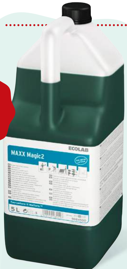
MAXX MAGIC2 ECOLAB Détergent super actif, sans rinçage, concentré, pour le lavage manuel ou mécanisé. Nettoie en profondeur les surfaces sales et grasses et évite le ré-encrassement. Bidon de 5 l Colis de 2 Code : 253689

RETROUVEZ TOUTE PRO! NOTRE SÉLECTION MO!