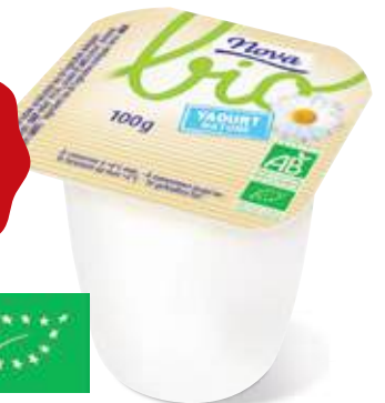
YAOURT NATURE AU LAIT ENTIER BIO NOVA Pot de 100 g Colis de 24 Code : 257343 Soit 8,11€ LE COLIS