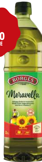
HUILE MERAVELLA BORGES Pour assaisonnement et rissolage (20 % d'huile d'olive vierge - 80 % d'huile de tournesol). Bouteille de 1 l Colis de 15 Code : 471581