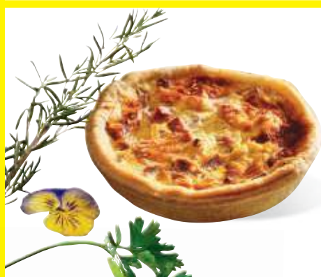
❁ QUICHE LORRAINE CRUE LA SAVOUREUSE Pièce de 200 g Colis de 18 Code : 245540 Soit 25,13€ LE COLIS